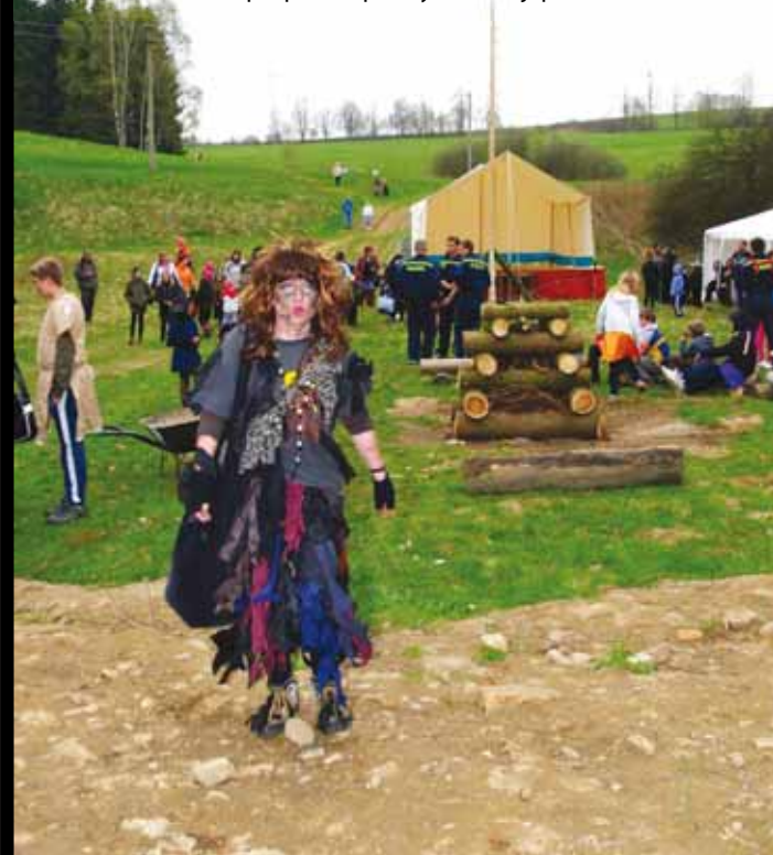
Nechyběl ani tělocvik „pavučinolezectví“

Apropó... Reparáty se konají příští rok.