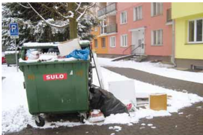
I takto umí někteří „ozdobit“ naše město.

V případě nedodržení této povinnosti bude Město Horní Slavkov uplatňovat sankci dle zákona č. 200/1990 Sb. zákon o přestupcích § 47 odst.1) písm. i, kde je možné ulo-