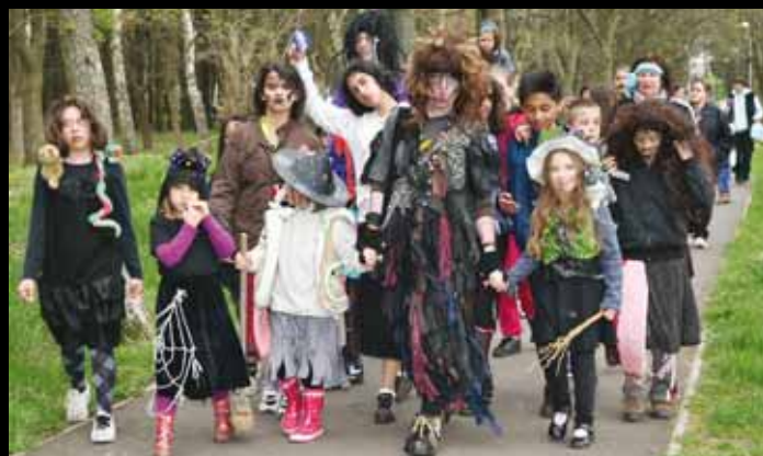
Odlet na tajemné místo byl z náměstí