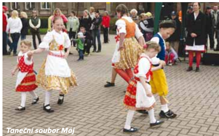
Taneční soubor Máj

a neúrodě, se na svůj svátek v sobotu 4. května opravdu nenechal zahanbit a vláhy seslal na účinkující poměrně dost. Ti a ani přihlížející se však nedali odradit, a tak program úspěšně po-