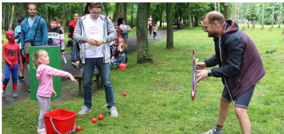
Na stanovištích děti trénovaly své schopnosti. Na jednom z nich se pokoušely prolomit mocný štít Kapitána Ameriky.

V pátek 25. 6. 2021 se místní lesopark proměnil v místo setkání superhrdinů. Přišlo jich víc než tři stovky a dorazily dokonce z Bečova, Ostrova či Karlových Varů. Nachystáno bylo 9 stanovišť s verzí pro malé i velké superhrdiny. Ani lehký déšť naše superhrdiny nezastrašil a všichni prošli supertréninkem až do konce. Vystavení průkazu superhrdiny jako důkazu superschopností, byla jednou z odměn, které si snad příjemně unavené, ale podle usmívajících se tváří rozhodně spokojené děti odnesly domů.