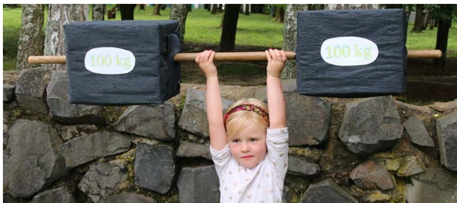
Postupným zlepšováním svých superschopností získaly děti i neskutečnou sílu. Zlehka zdvihaly těžká břemena nad hlavu nebo kladivem silného Thora drtily předměty na placku.