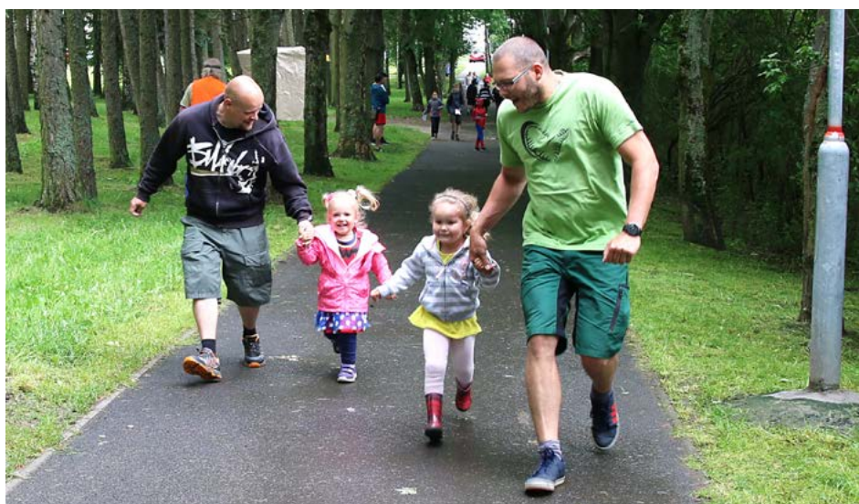
Do tréninku se zapojili i rodiče. Green Arrow je školil v lukostřelbě, rychlost svých nohou otestovali na stanovišti u Flashe.