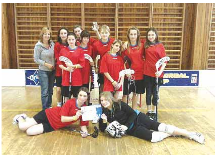
Florbalistky vybojovaly při své premiéře v krajském kole 5. místo.