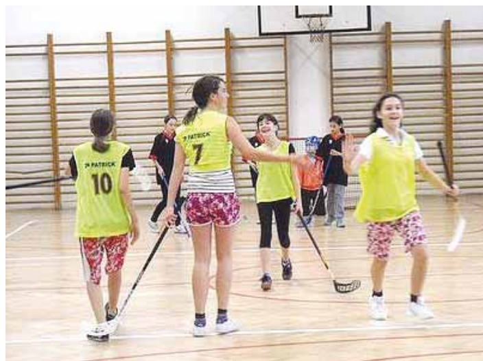
Vítězství v okrskovém kole znamenalo pro naše hráčky postup do okresního turnaje. Ze Sokolova se vrátily se stříbrným pohárem.

Po jarních prázdninách, které letos byly opravdu plné mrazu a sněhu, se žáci vrátili aspoň trochu odpočatí a jestli stihnou mimo získávání vědomostí, dovedností a správných návyků ještě nějaký mimoškolní úspěch, nezapomenu vás o tom informovat.