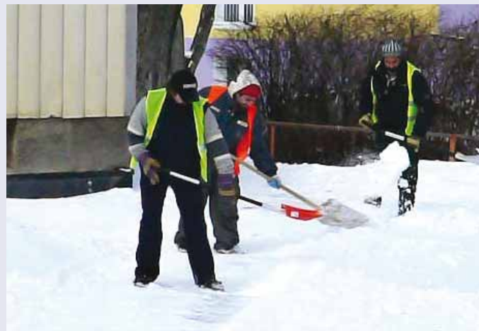
Úklid sněhu na chodnicích k Zahradní ulici v rámci veřejně prospěšných prací