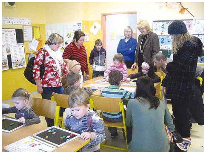
Pohádka O Budulínkovi přilákala do naší školy téměř třicet budoucích školáků.

Předškoláci u nás přítom nebyli naposledy. V hojném počtu se hned zkraje února dostavili na první setkání z cyklu Do školy za pohádkou. Do prázdnin se k nám mohou s rodiči vydat ještě dvakrát – 14. března a 11. dubna. Velmi se na všechny těšíme.