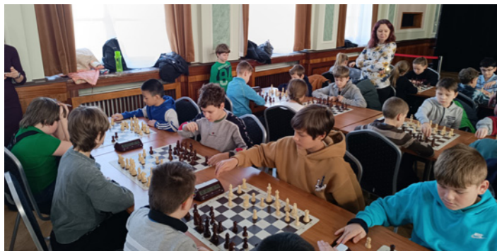
4. 3. krajské kolo šachový turnaj, Ostrov (1. st.-11. místo, 2. st.-10. místo)