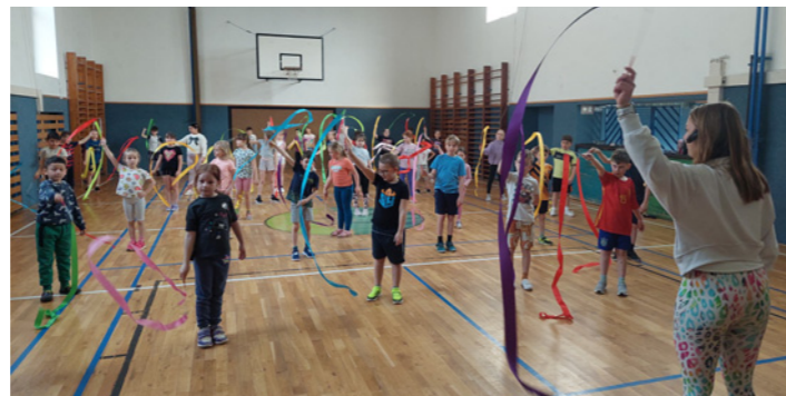
10. 3. Děti v pohybu-sportovní akce (pro 1. i 2. stupeň)