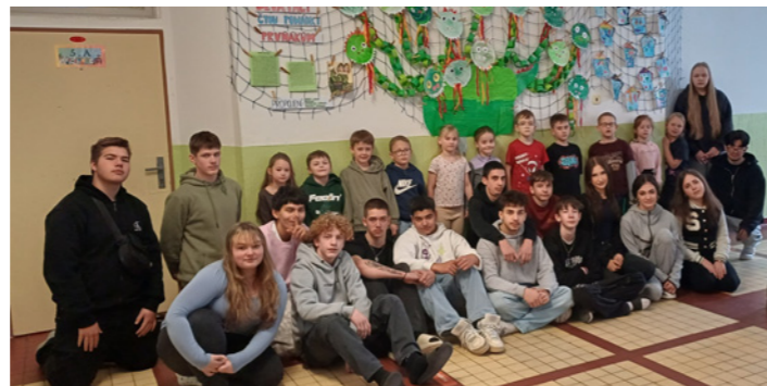
Pohádky spojují-čtení a vyrábění 9.A s 1.A (pohádkový drak)