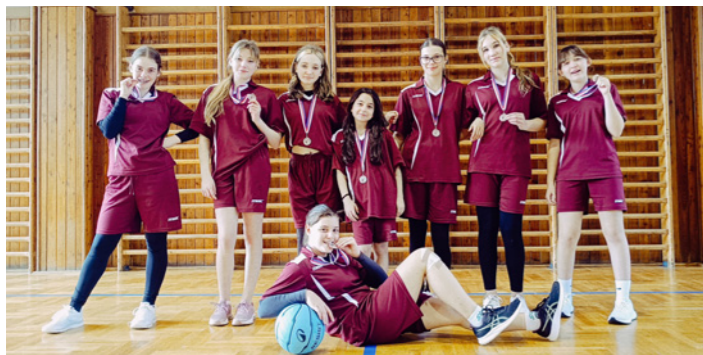
12. 3. okresní kolo basketbal-2.místo (6. a 7. ročník), postup do krajského finále