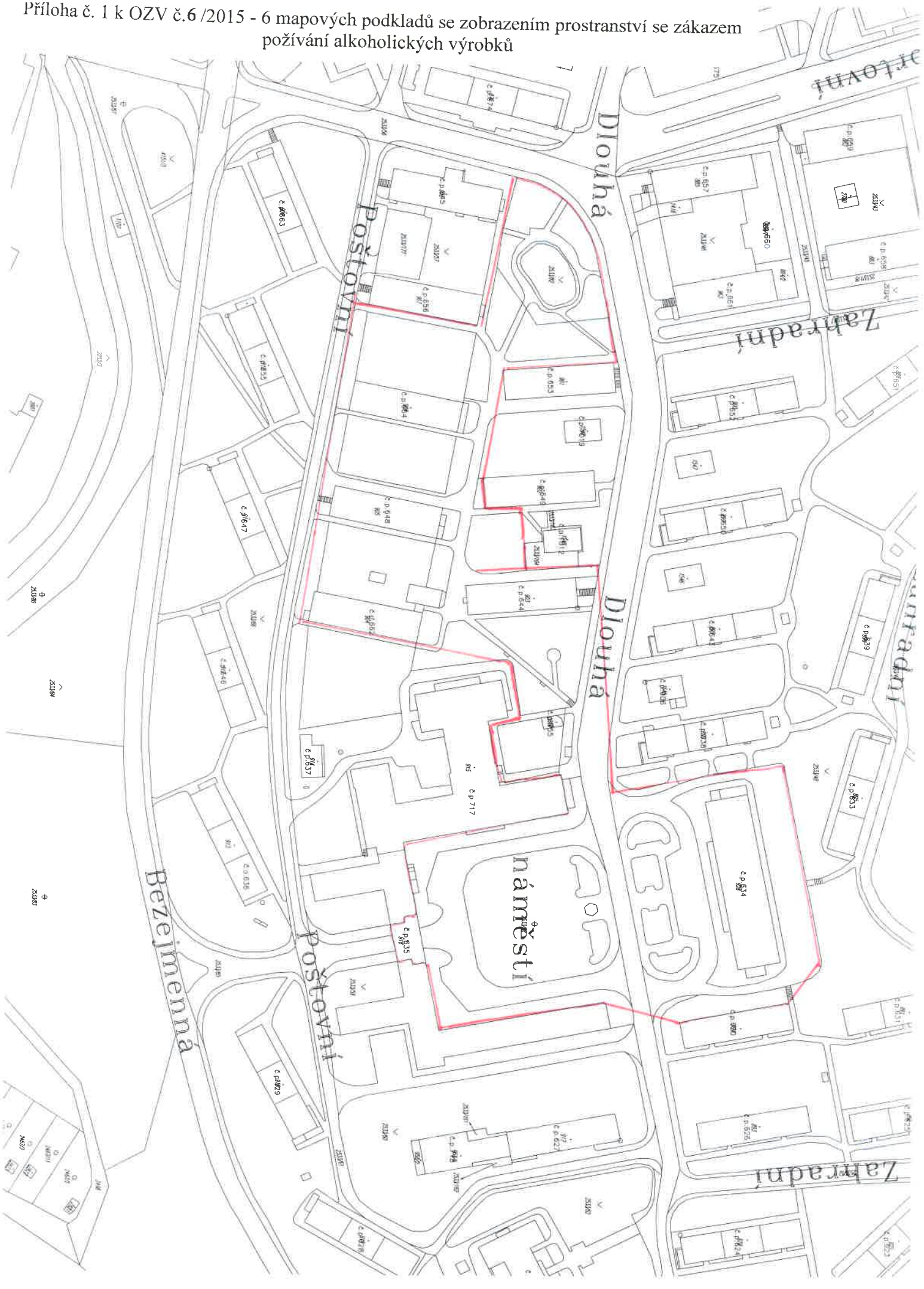
Příloha č. 1 k OZV č.6/2015 - 6 mapových podkladů se zobrazením prostranství se zákazem požívání alkoholických výrobků