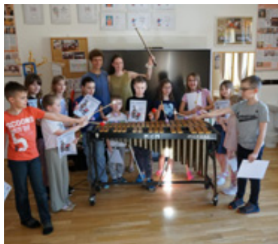
Skladatelské odpoledne Loket