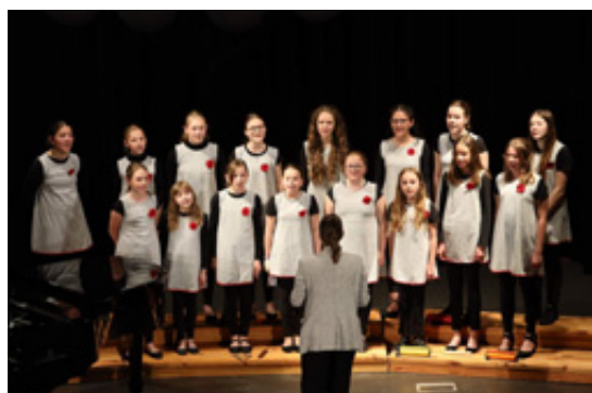
PS Papaveri soutěž Loket