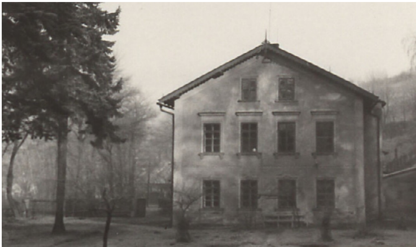
Dětské středisko čp. 418

V přepočtu na počty obyvatel v roce 1960 již jen 6500 je úroveň zdravotnické péče na takové úrovni, že daleko převyšuje celostátní průměr, ba možno říci, že kromě určitých částí Prahy, není v republice vůbec porovnání. Úroveň zdravotnictví je dána i dobrou lékařskou osvětovou činností ve spolupráci se skupinou ČSČK. Rovněž zdravotní sestry mají velký podíl na dobré zdravotnické situaci ve městě. Matky v šestinedělí navštěvuje porodní asistentka, rehabilitační sestra se stará o to, aby lidé po úrazech se opět brzo mohli zapojit do práce, protialkoholní poradna umožňuje alkoholikům návrat do společnosti i práce. Na každé šachtě je zřízena ošetřovna, kde zdravotní sestra ošetřuje drobné úrazy, a poskytuje první pomoc raněným do příchodu lékaře nebo sanitního vozu. Složka zdravotnických služeb v Horním Slavkově je v roce 1960 na úrovni skutečně dobré.