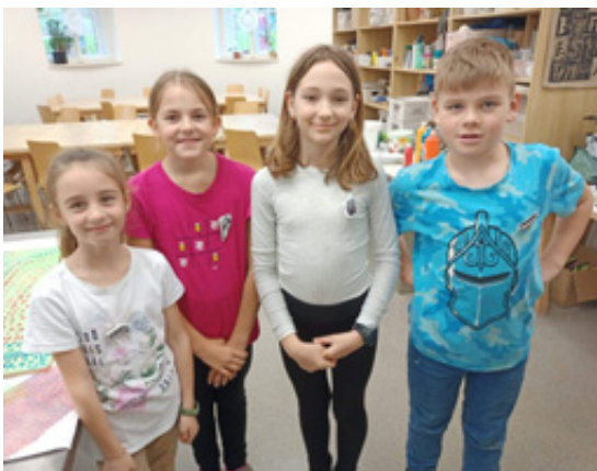
žáci VO Krásno Becherova vila KV