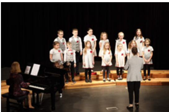
PS Vlaštovky soutěž Loket