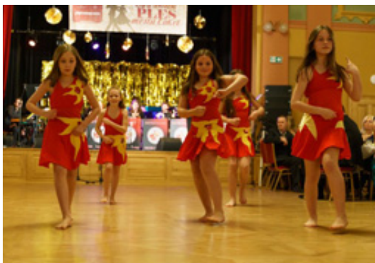
Předtančení - Ples města Loket