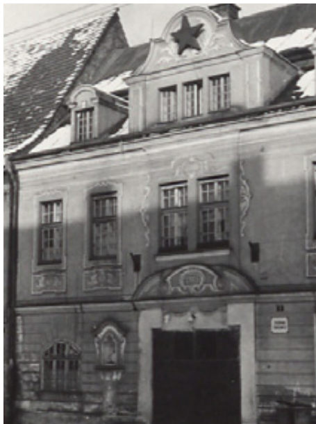
Budova ordinace čp. 3 na náměstí

služby. Z počátku se v ní střídali pouze 2 lékaři; celý týden sloužil ve dne i v noci jeden lékař, příští týden pak druhý. Ke „zlepšení“ došlo pak přidělením třetího lékaře. Přesto připadlo na jednoho lékaře 10 nočních služeb za měsíc. Přitom se pohybovala ordinanční návštěvnost za ordinanční dobu kolem 130–140 lidí. Ještě v roce 1952 se stěhuje ordinace na dřevěné sídliště. Rozdíl byl jen ve větším počtu místností, o hygienických podmínkách se nedalo hovořit. V roce 1955 se stěhuje ordinace do nově adaptované budovy čp. 3 na náměstí, kde je již možnost zřízení ordinace gynekologické, neurologické, ušní, krční, kožní a zubní.