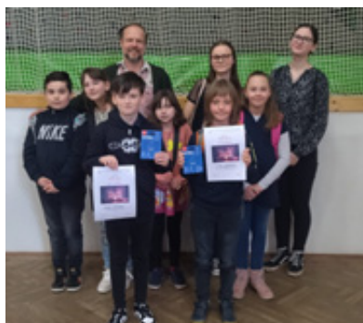
Soutěž LDO Sokolov