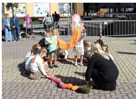
Jak to vypadá na pouti, o tom nám zazpívaly a zatančily děti z MŠ U Sluníčka.