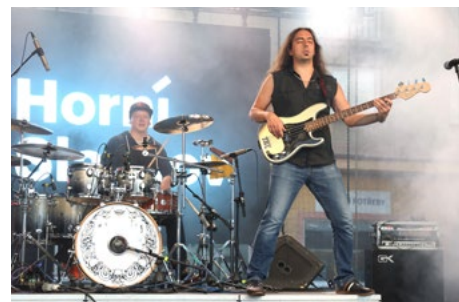
... navázal Tajfun ..