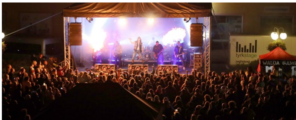
... a program při stále plném náměstí uzavíral Walda gang.