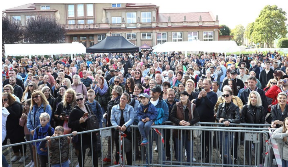
Díky velmi příznivému počasí a skupině Holki bylo náměstí plné už začátku programu.