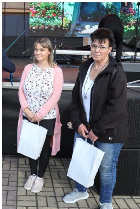
Nechybělo ani vyhlášení výsledků soutěže „Rozkvetlé okno“.