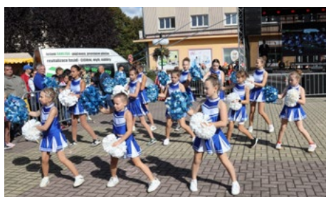
Tančem navázaly i roztleskávačky ze ZŠ Nádražní ul.