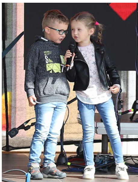
Zahájení letošních Slavkovských slavností patřilo nejmenším – Děti z MŠ Duhová kulička.