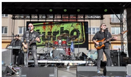
O další zábavu na náměstí se postarala kapela Turbo ...