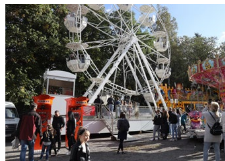
Parkoviště u hřiště „u rakety“ zaplnily pouťové atrakce.