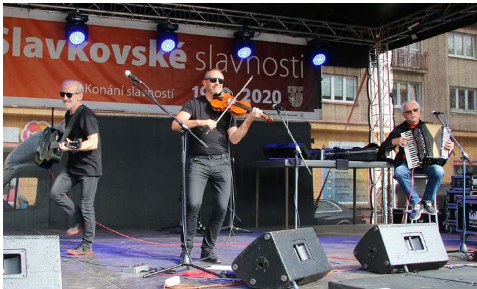
Čechomor dorazili ve třech, ale instrumentální podání jejich nejznámějších písní nemělo chybu.