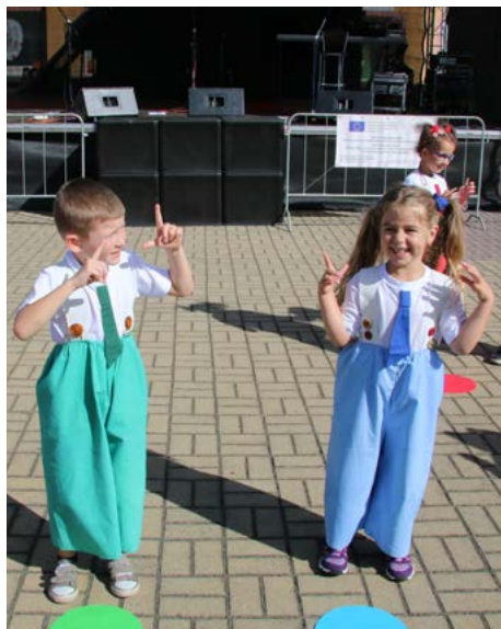
Děti ze školky Duhová kulička zahájily letošní slavnosti.

Děkujeme všem, kteří se podíleli na organizaci a přípravě slavností. Nutno podotknout, že na realizaci akce přispěl finančními prostředky Karlovarský kraj, a že akce byla součástí „Kulturního září na Sokolovsku 2020“.