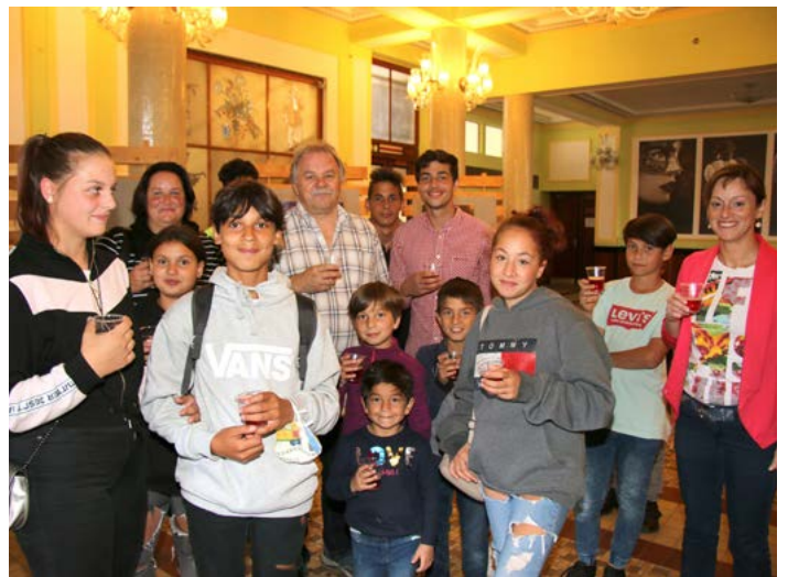
Začínající umělci z Dětského domu Horní Slavkov a Cheb zahájili výstavu výtvarných prací, kterou můžete navštívit ve vestibulu MKS do konce října.