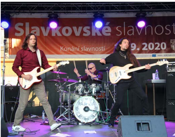
Když se v podvečer prohnal náměstím Tajfun, bylo jasné, že zábava rozhodně nekončí.