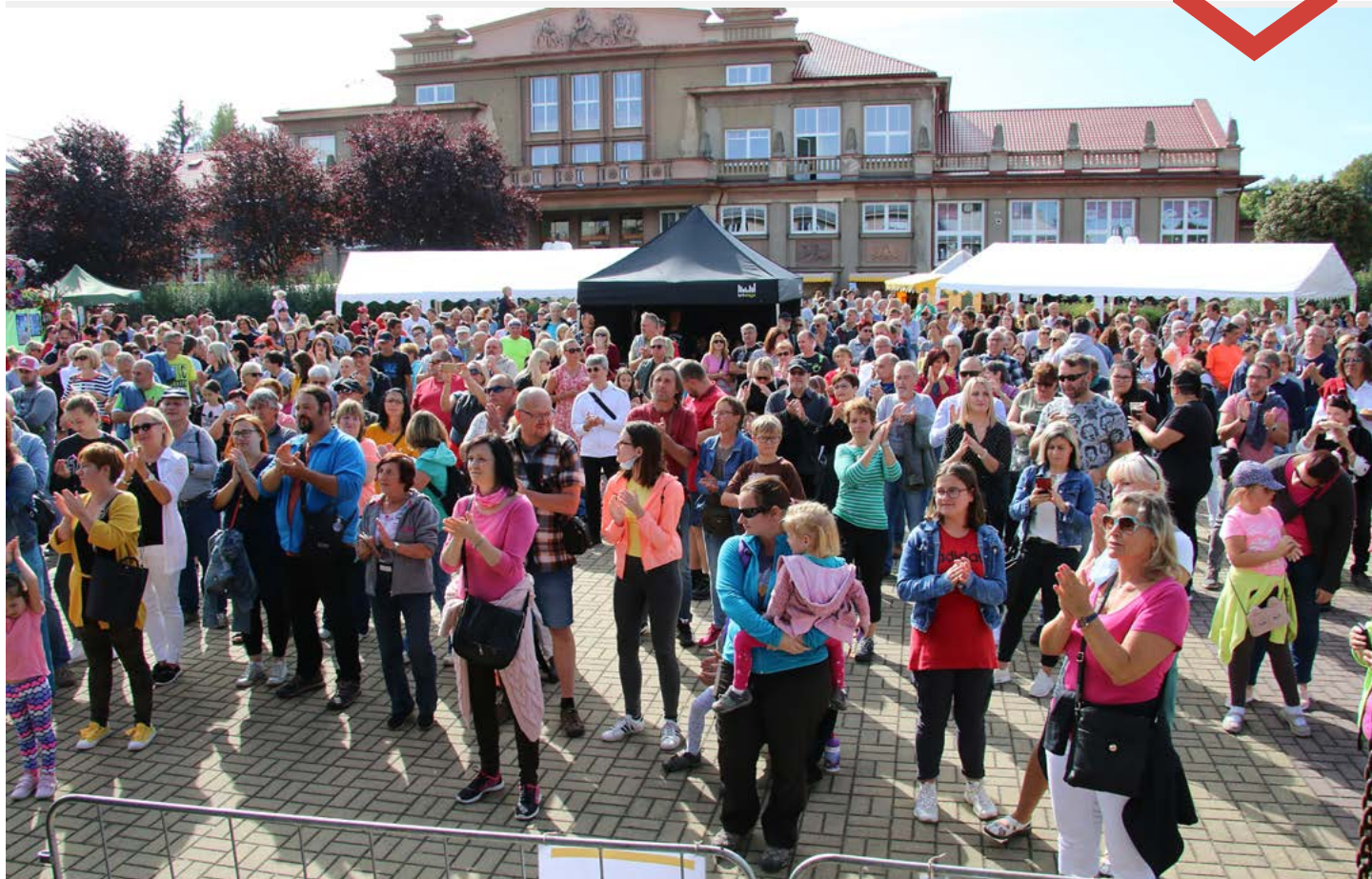
Náměstí rozhodně nezelo prázdnotou a kdo chtěl, bavil se až do večera.

Děkujeme všem, kteří se podíleli na organizaci a přípravě slavností. Nutno podotknout, že na realizaci akce přispěl finančními prostředky Karlovarský kraj, a že akce byla součástí „Kulturního září na Sokolovsku 2020“.