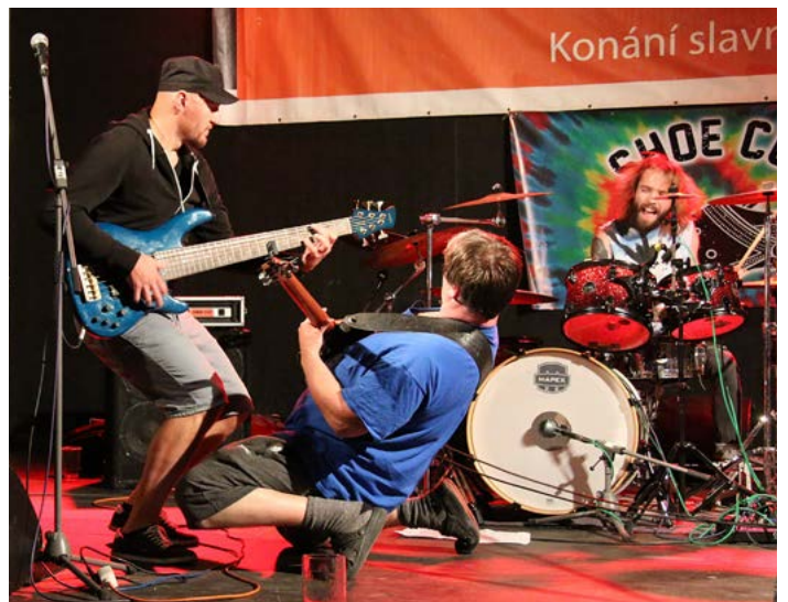
Slavkovští Shoe cut byli poslední kapelou v programu a pak už se tančilo jen v rytmu písni DJe.