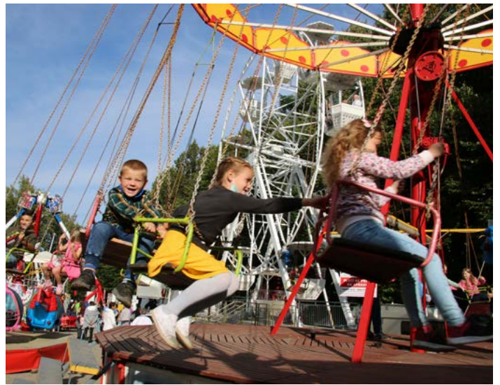
Ke slavnostem neodmyslitelně patří poutové atrakce. Přestože k nám dorazily i novinky, klasický řetězák má stále své kouzlo.