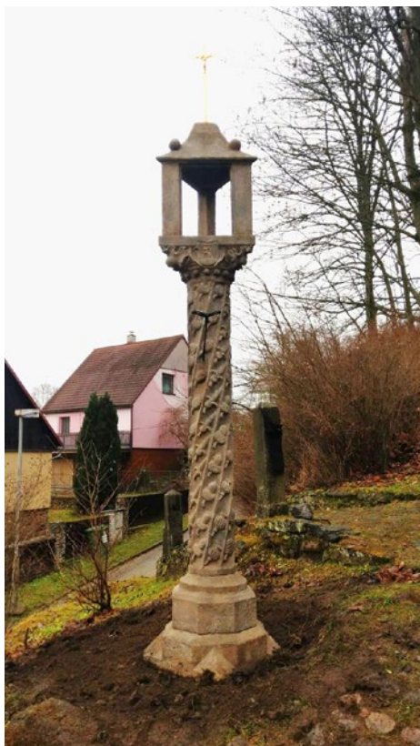
Kamenná zádušní svítilna po obnově

Na obnovu této kulturní památky byl čerpán příspěvek 177.000,-Kč z Programu regenerace městských památkových rezervací a městských památkových zón na rok 2019 vyhlášeným Ministerstvem kultury ČR. Výše celkových nákladů byla 265.716,-Kč vč. DPH. Sloupková pískovcová zádušní svítilna pochází z druhé poloviny 16. století a nachází se při přístupové cestě ke kostelu sv. Jiří z Kostelní ulice, v pramenech je také nazývána jako Hässlerův sloup. Původně stávala u hrobu Georga Hesslera (Häslera). Dle dobové obrazové dokumentace byla zádušní svítilna původně zasklená. Památkově chráněna od 20. prosince 1963.