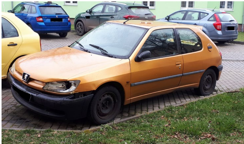
Vozidlo z Poštovní ulice, které splňuje nově definici autovraku