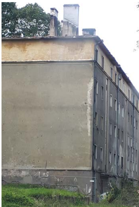
Obytný dům před odstraněním

Použití tohoto recyklátu, jak na cestu, tak v Hasičské ulici (za výcvikovým prostorem hasičů) bylo předmětem kritiky občanů.