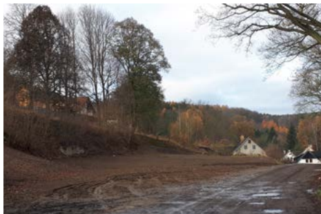
Ulice Dolní Příkopy po odstranění domu

Dům i přes průběžné opravy vlivem nájemníků chátral. Od roku 2012 město připravovalo dům z důvodu neekonomičnosti jeho opravy k jeho vyklizení a odstranění. Na podzim loňského roku byla historie domu uzavřena, dům byl odstraněn.