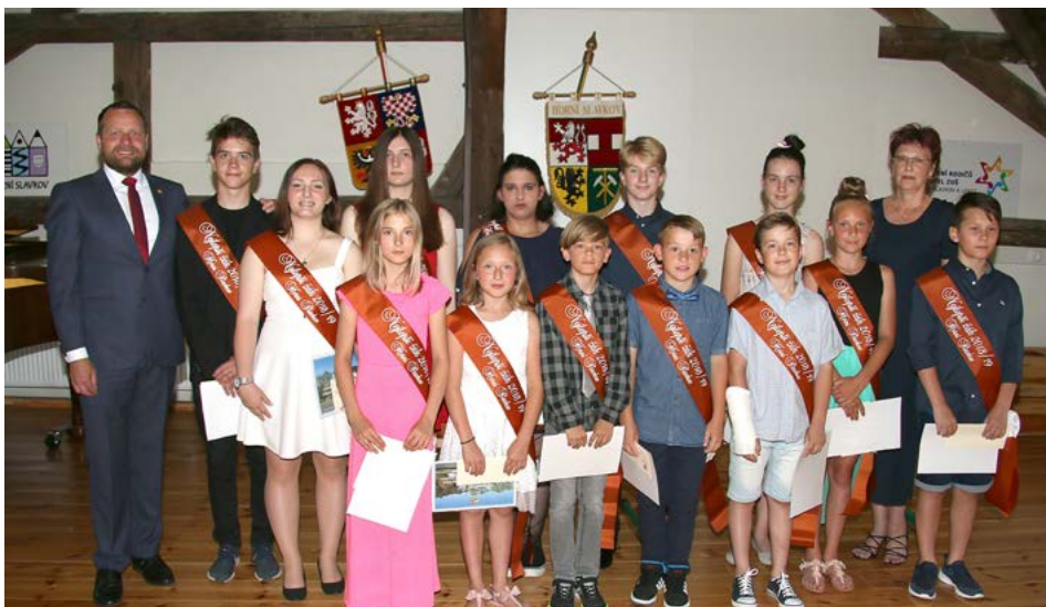
Základní škola Horní Slavkov, Školní ulice

ocenění za píli a stálou připravenost na vyučovací hodiny, aktivní přístup ke studiu, za velké pokroky v druhém nástroji (cello), za