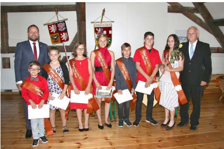
Základní škola Horní Slavkov, Nádražní ulice