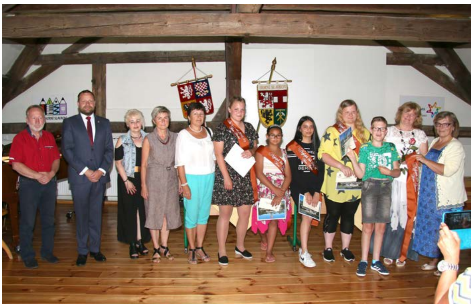
Základní škola Šance Horní Slavkov