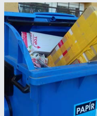
Papír sice správně roztřídí, ale krabice nesešlapanuté.