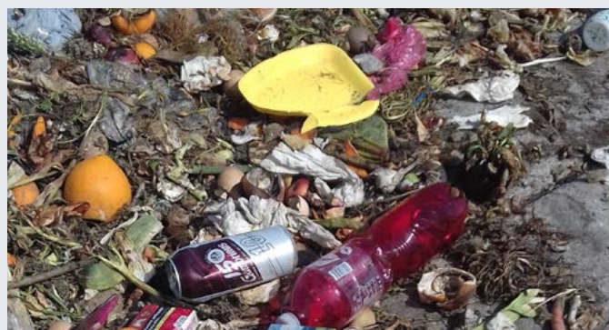
PET lahve, plechovky a jiný smíšený odpad do bioodpadu nepatří.

kontejnerů nebo výstavbu nových krytých stání.