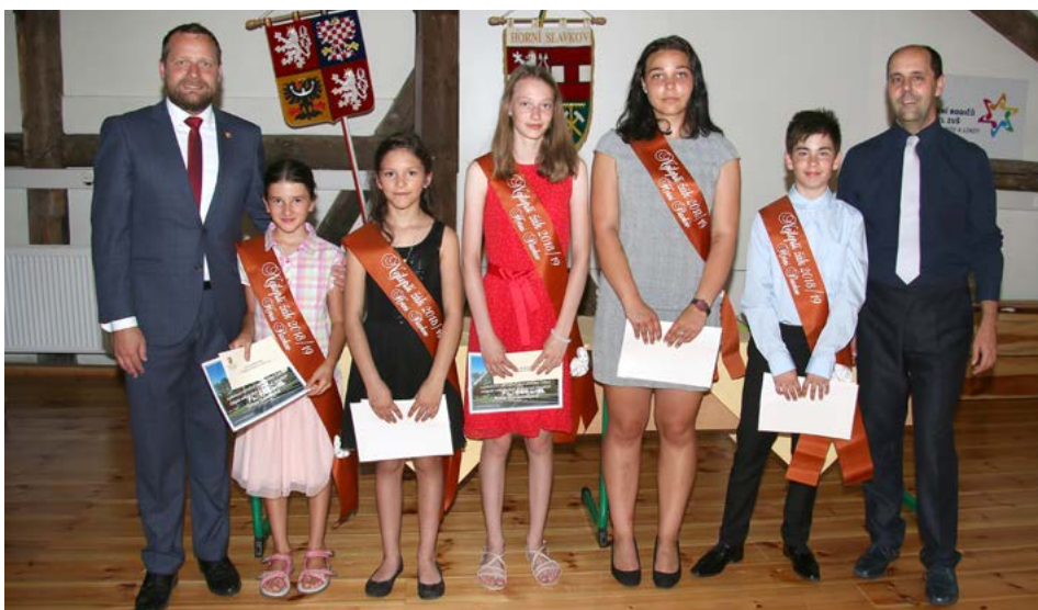
Základní umělecká škola Horní Slavkov

velmi dobrou reprezentaci školy při veřejných akcích, za vstřícný a příkladný přístup k úkolům, stálou ochotu ke spolupráci a samozřejmě za dobré chování. Její osobnost je dobrým příkladem pro ostatní žáky