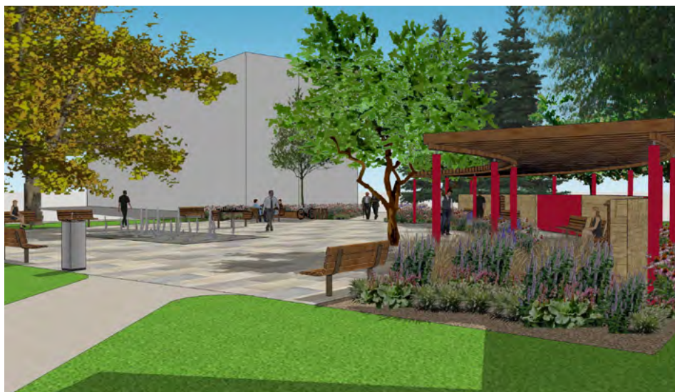
Vizualizace vzhledu parku podle projektu