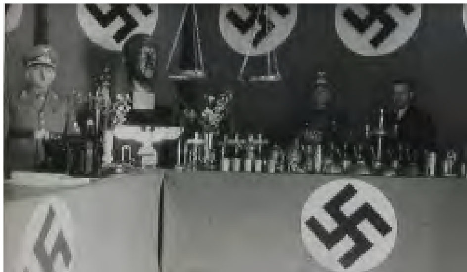
Na počest narození vůdce proběhla sbírka kovových předmětů