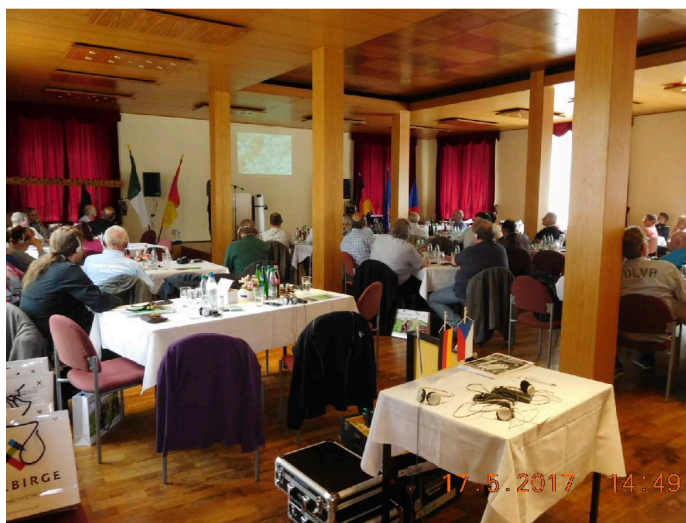
Pohled do sálu