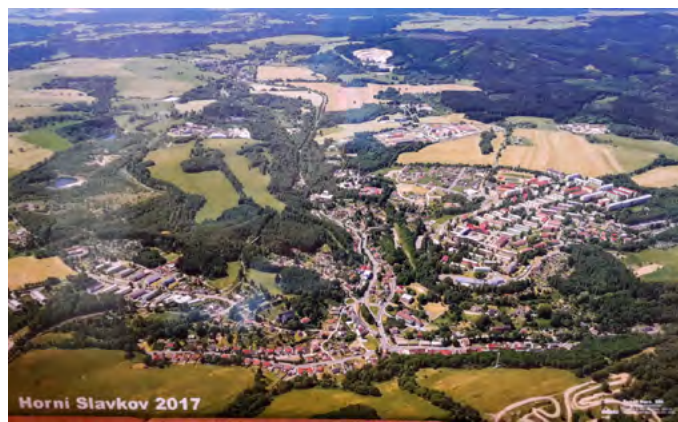
Horní Slavkov 2017

V případě zájmu kontaktujte sekretariát městského úřadu na tel. 352 350 665 nebo jana.wiedova@hornislavkov.cz . Snímek dle objednávky necháme zhotovit.