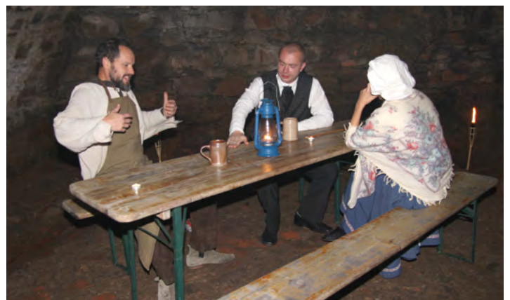
...a vše skončilo v šenku.