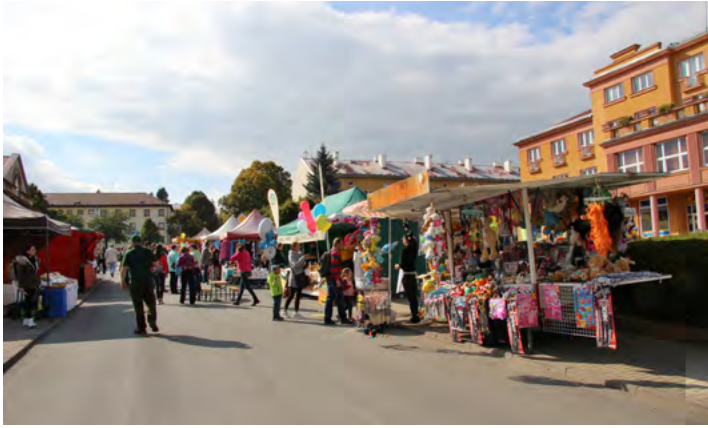
Pestrá nabídka stánků