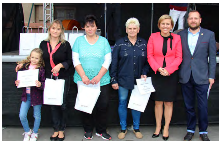
Vítězové soutěže Rozkvetlé okno v kategorii okna v bytech