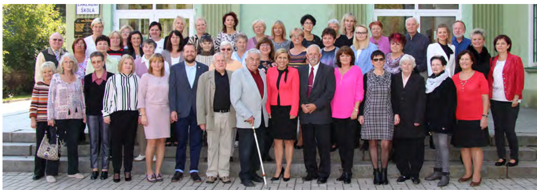
Bývalí i soušní zaměstnanci školy

něna pro všechny zájemce a to nejen v tzv. kiwi budově, ale i ve žluté budově. Ta je nejstarší školní budovou ve městě. Prohlídku školy využilo přes 100 občanů.