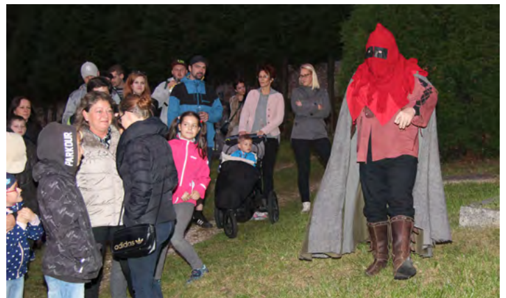
Letos poprvé byly prohlídky historického jádra města doplněny zápletkou v podání herců Chebského divadla...