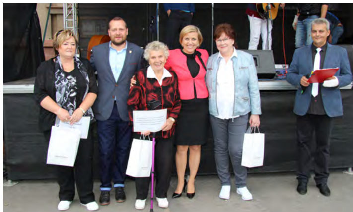
Vítězové soutěže Rozkvetlé okno v kategorii okna v domech