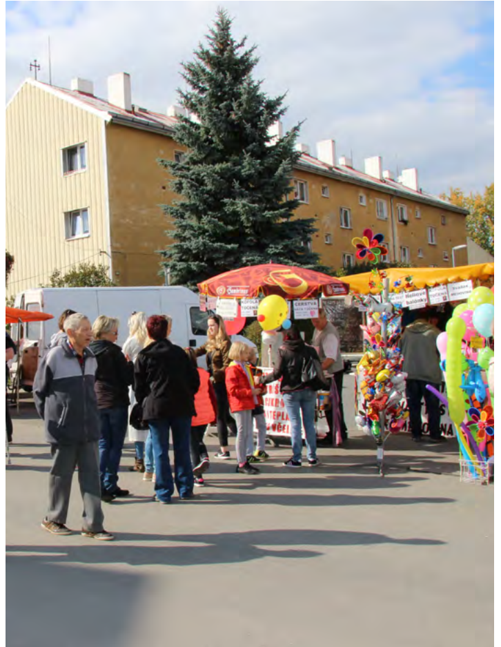
Počasí bylo jako na objednávku....