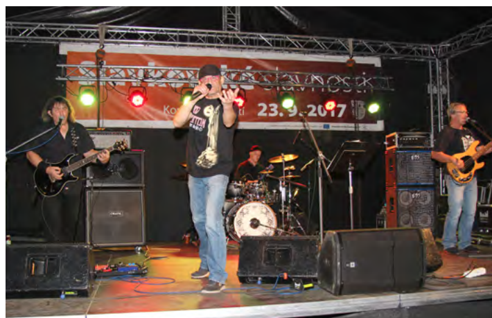
Beat Club 68'