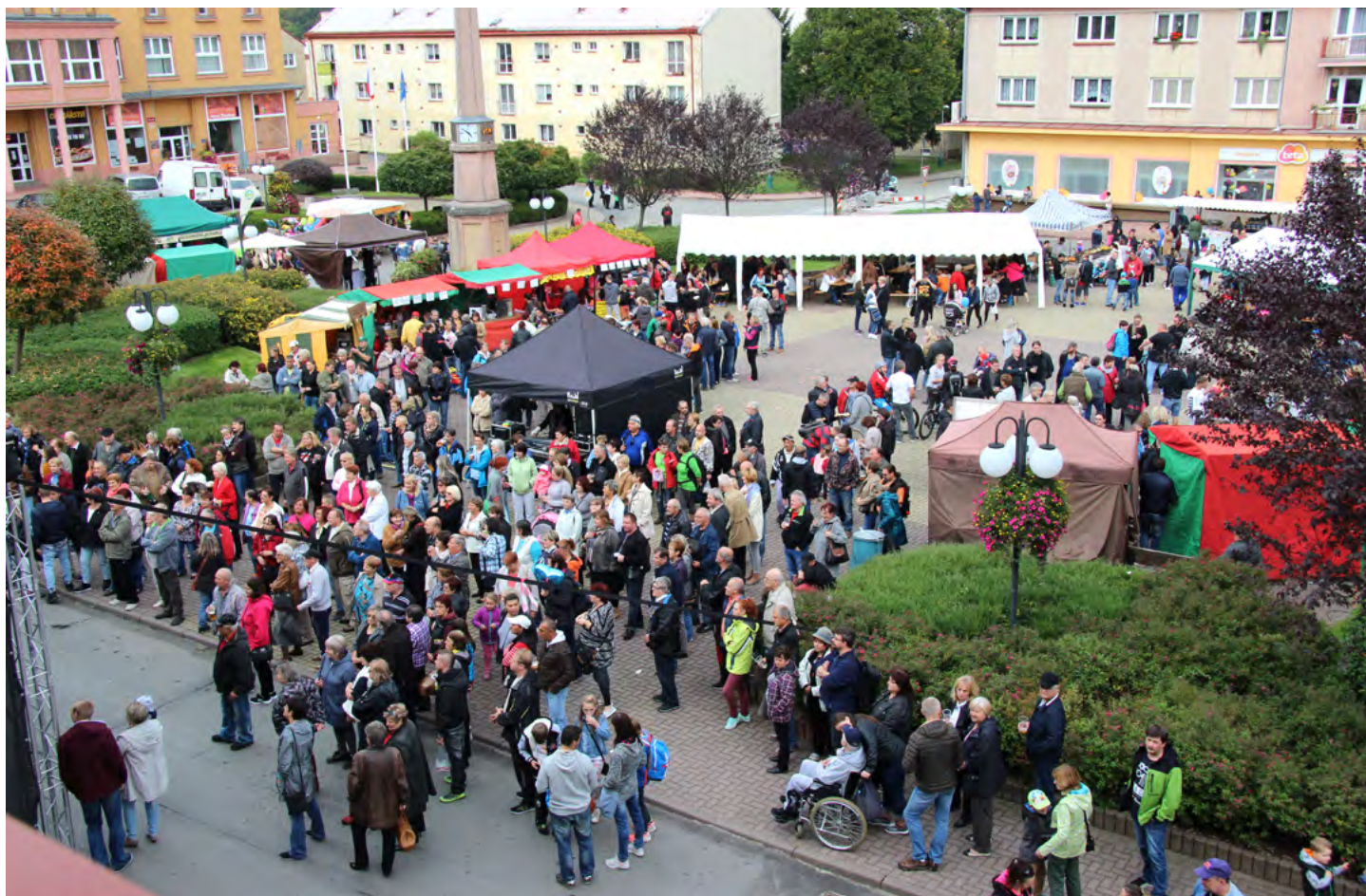
Účast byla hojná