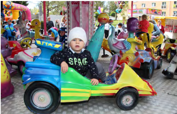
Nechyběly pouťové atrakce