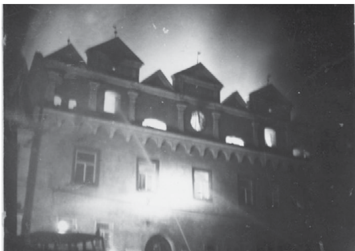
V noci 28. září 1977 se od vadného komína vzňala střecha radnice, prohořelo celé podlaží a z této historické památky zůstaly jen obvodové zdi.