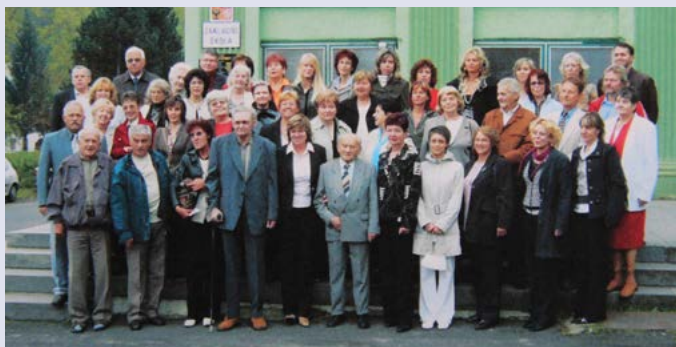
Fotografie byla pořízena u příležitosti 50. výročí v roce 2007.

Srdečně zveme všechny bývalé pedagogické i provozní zaměstnance školy k účasti.