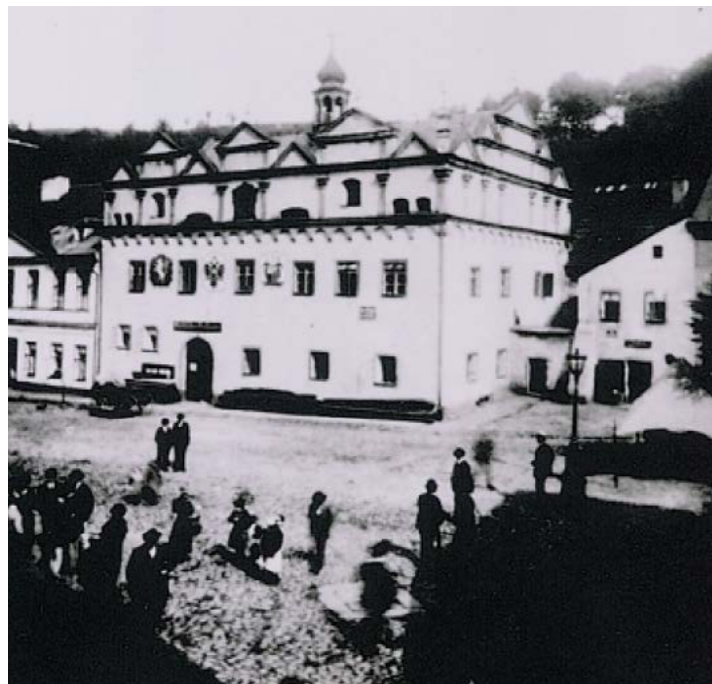
Nejstarší známá fotografie renesanční radnice na dnešním náměstí Republiky z roku 1886. Dobová pohlednice z archivu Okresního muzea Sokolov.