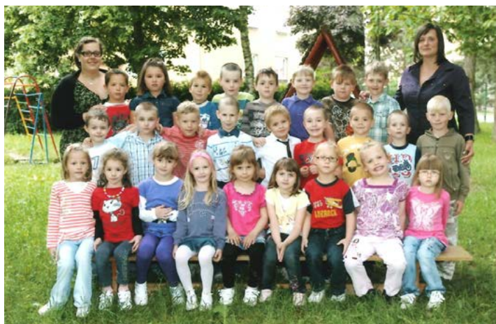
MŠ DUHOVÁ KULIČKA ŠKOLNÍ ROK 2009-2010 V HORNÍM SLAVKOVĚ

Ve školním roce 2006/2007 bylo pro 2-3leté děti a jejich rodiče otevřeno Baby centrum. Tohoto kroužku se 1x týdně účastnili rodiče společně s dětmi. Novou nabídkou byl také keramický kroužek, na který posluchači docházely do MěKS. Děti se každoročně účastnily kulturních akcí ve školce, v MěKS, v Sokolově nebo v Karlových Varech. Rodiče mohli využívat nabídek stínového a podzimního fotografování dětí. Pěknou akcí bylo také zajištění besedy