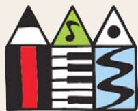
ZUŠ HORNÍ SLAVKOV

Školní rok 2016/2017 zahájíme 1. září 2016, od 14:00 do 17:00 hodin bude možná domluva rozvrhů individuálních výuky u jednotlivých pedagogů, rozvrhy kolektivní výuky