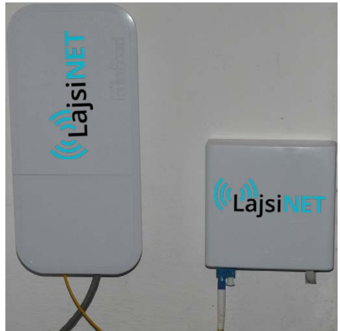
Ukázka účastnické zásuvky a optického převodníku

O průběhu všech jednání a postupu Vás budeme průběžně informovat jak ve zpravodaji, tak na našem facebookovém profilu. Věříme, že všechny obyvatele bude zajímat, jak celý projekt postupuje, a přejeme si, aby všechna jednání probíhala otevřeně a bez tajností.