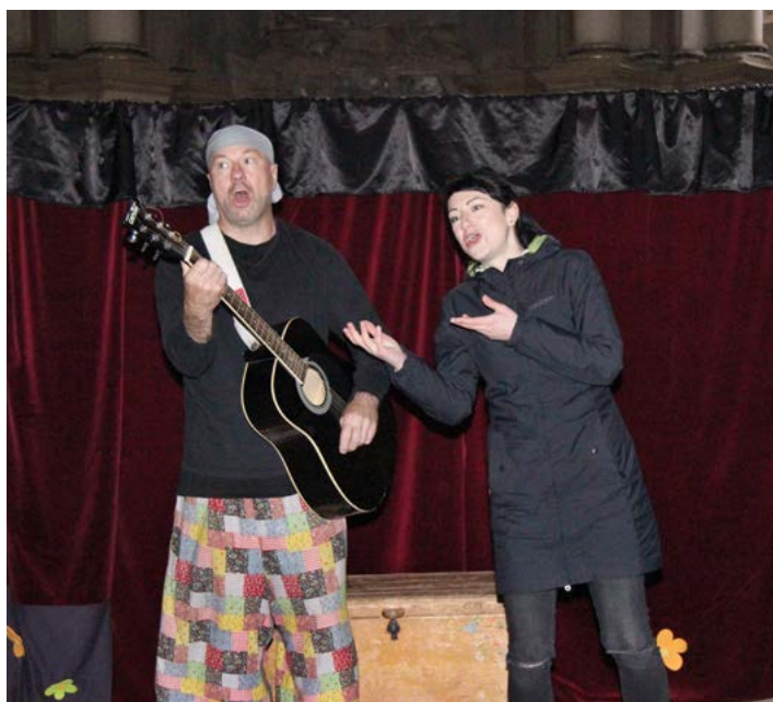
Odpoledne zakončilo Divadlo z bedny