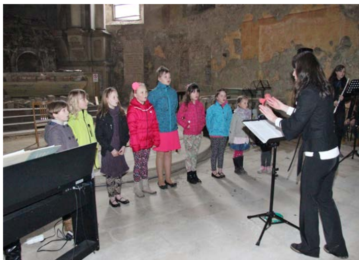
Velmi roztomilé bylo vystoupení v podání těch nejmladších z Pěveckého sboru ZUŠ Horní Slavkov