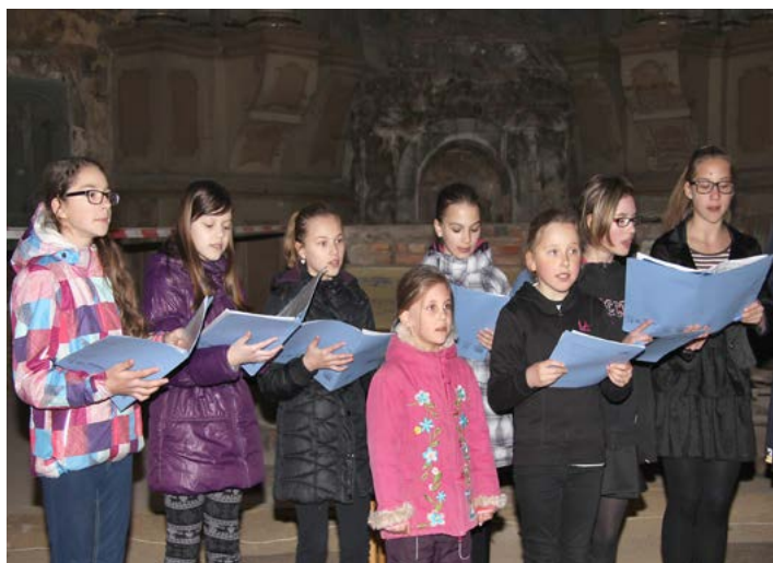
Hudební vystoupení zakončil Pěvecký sbor ZUŠ Horní Slavkov