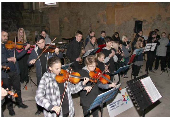
Největší hudební těleso ZUŠ band úžasně rozeznělo stěny kostela