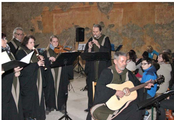
Krásnou atmosféru navodil pěvecký sbor Cubitus z Lokte