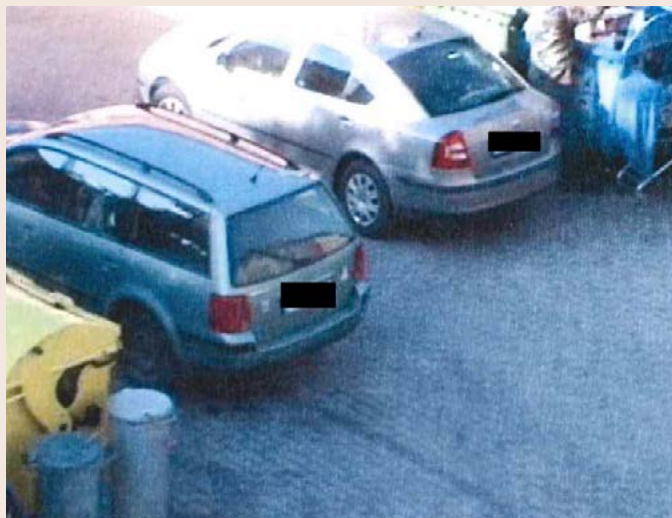
Známa osoba zachycena při vybírání