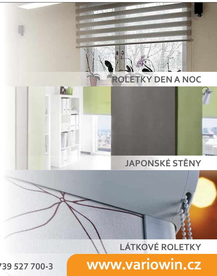
ROLETKY DEN A NOC