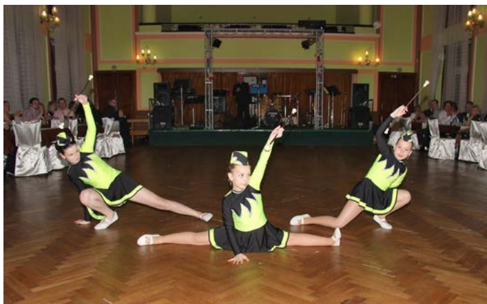
Vystoupení mažoretek při DDM Horní Slavkov

Návštěvníci si mohli zatančit při hudební produkci početného Sokolovského tanečního orchestru, zhlédnout vystoupení mažoretek /Sedmikrásky při DDM Horní Slavkov/ nebo exhibici pole dance karlovarského studia Pandora Pole Fitness. S velkým zájmem se setkala ukázka karate, kterou předvedli členové Champions Teamu karate Horní Slavkov. Ti také převzali ocenění města za vzornou reprezentaci při domácích i mezinárodních soutěžích.