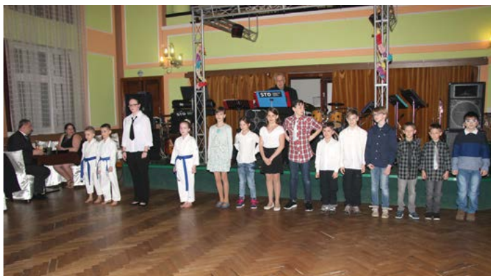
Členové Champions Teamu karate Horní Slavkov

Návštěvníci si mohli zatančit při hudební produkci početného Sokolovského tanečního orchestru, zhlédnout vystoupení mažoretek /Sedmikrásky při DDM Horní Slavkov/ nebo exhibici pole dance karlovarského studia Pandora Pole Fitness. S velkým zájmem se setkala ukázka karate, kterou předvedli členové Champions Teamu karate Horní Slavkov. Ti také převzali ocenění města za vzornou reprezentaci při domácích i mezinárodních soutěžích.