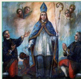
Část praporu se sv. Prokopem

Přednáška se uskuteční ve čtvrtek 10. března v tanečním sále MKS od 18,00 hod