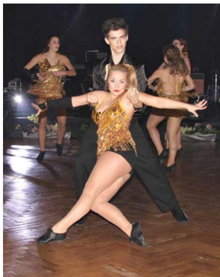
Taneční skupina Mirákl