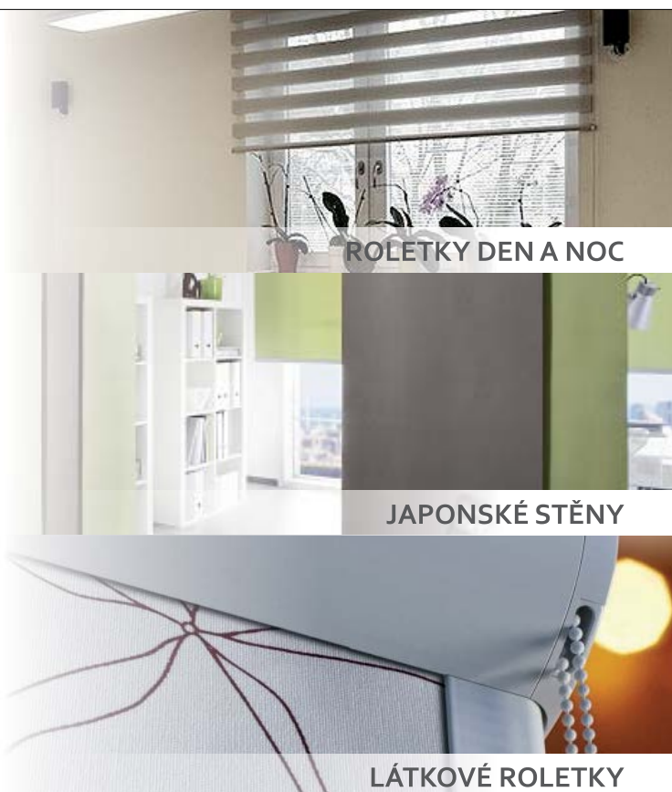
ROLETKY DEN A NOC