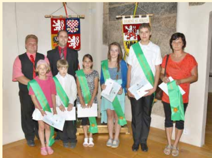
ZUŠ Horní Slavkov