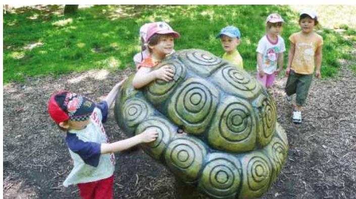
Děti z MŠ U Sluníčka na výletě v ZOO Chomutov.

Děti oblečené do masek tančily a součtily ve třídách. Po svačince se vyda-