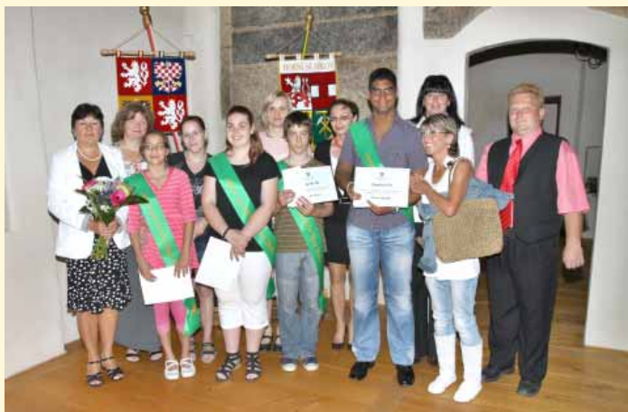
ZŠ praktická a ZŠ speciální Horní Slavkov