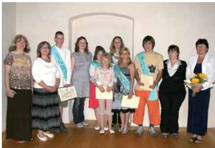
Nejlepší žáci ZŠ praktické a ZŠ speciální, Horní Slavkov