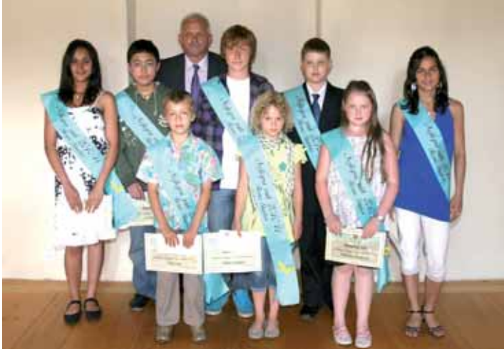
Nejlepší žáci ZŠ Nádražní, Horní Slavkov