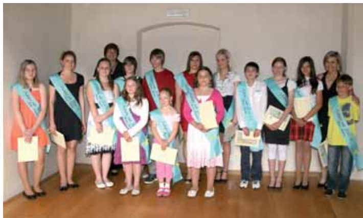
Nejlepší žáci ZŠ Školní, Horní Slavkov